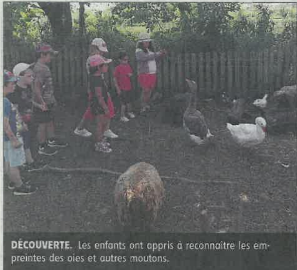
DÉCOUVERTE. Les enfants ont appris à reconnaître les empreintes des oies et autres moutons.

Passer du coq à l'âne, telle a été l'activité de la sortie organisée la semaine dernière par le centre de loisirs des Familles rurales.