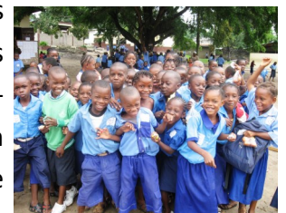
Les élèves des classes primaires

Après l'installation de panneaux solaires offrant de meilleures conditions de travail pour les enfants et les enseignants, la rénovation d'un certain nombre de classes de l'école Michel Gobin semble s'imposer. La photo ci-contre nous montre la nécessité de ces travaux. Merci aux donateurs qui soutiennent l'école depuis plusieurs années.