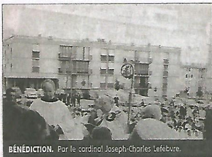
BÉNÉDICTION. Par le cardinal Joseph-Charles Lefebvre.