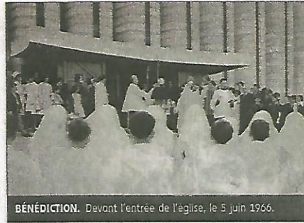
BÉNÉDICTION. Devant l'entrée de l'église, le 5 juin 1966.

Il y a cinquante ans, l'église Saint-Jean était bénie par le cardinal Joseph-Charles Lefebvre. Depuis, le bâtiment s'est bien intégré à son quartier.